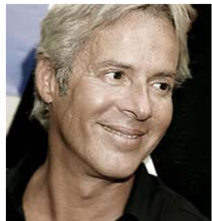
Il cantautore Claudio Baglioni, autore dell'inno per le Olimpiadi di Torino 2006