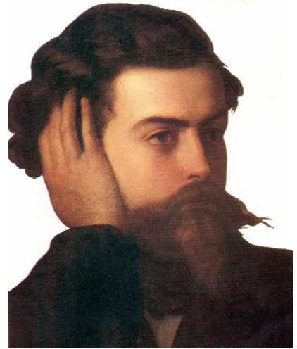
Il patriota genovese Goffredo Mameli (1827-1848), autore della poesia "Il canto degli italiani": il nostro inno nazionale.